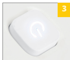
кнопка с подсветкой