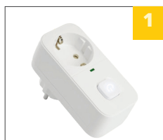
корпус из прочного ABS-пластика